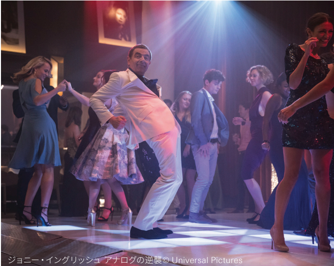
ジョニー・イングリッシュ アナログの逆襲