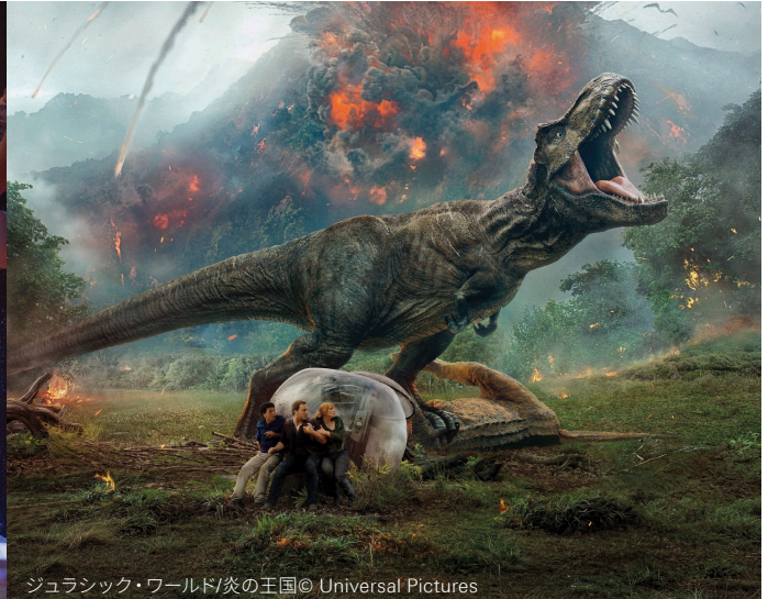
ジュラシック・ワールド/炎の王国

Motion Picture Solutions (MPS) がR&S®CLIPSTERで処理した2本の映画のシーン