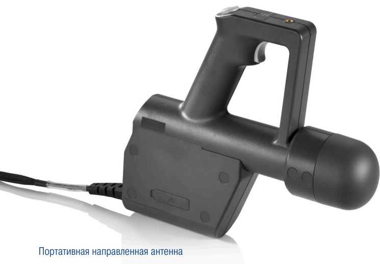
Портативная направленная антенна R&S®HE800-DC30 с понижающим преобразователем.

Портативная направленная антенна R&S®HE800-DC30 с понижающим преобразователем в сочетании с портативным мониторинговым приемником R&S®PR200 может обнаруживать и с высокой точностью устанавливать местоположение передатчиков и источников помех в диапазоне от 18 до 33 ГГц.