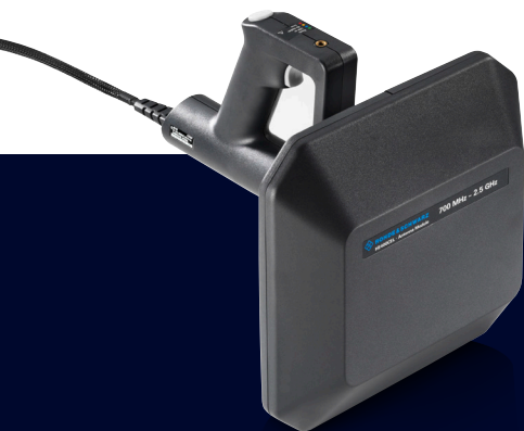
Портативная направленная СВЧ-антенна R&S®HE400MW с антенным модулем R&S®HE400CEL.

Антенны могут переключаться между нормальным режимом с четко выраженным максимумом, указывающим направление вперед, и дельта-режимом, при котором диаграмма направленности резко спадает в направлении визирования. Пеленгация на основе минимального сигнала в дельта-режиме позволяет пользователям находить источник сигнала гораздо точнее и быстрее. Оба антенных модуля могут работать с рукоятками R&S®HE400, R&S®HE400MW и R&S®HE400DC.