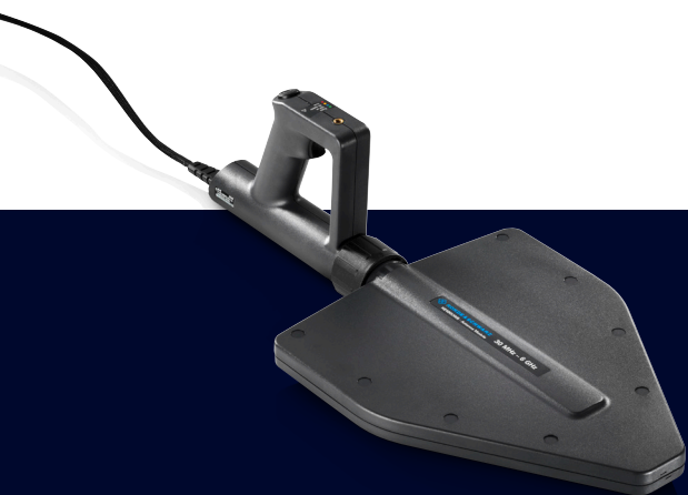
Портативная направленная антенна R&S®HE400 с антенным модулем R&S®HE400UWB.

Рабочий диапазон частот системы определяется нижней и верхней частотами портативной направленной антенны и приемника или анализатора.