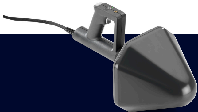
Портативная направленная СВЧ-антенна R&S®HE400MW с антенным модулем R&S®HE400SCB.