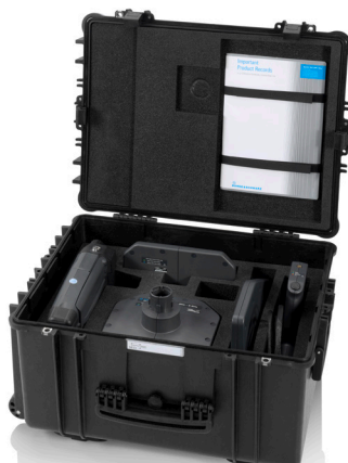
Транспортный кейс R&S®HE400Z5, рассчитанный на антенный модуль R&S®HE400SHF/HE400SCB.