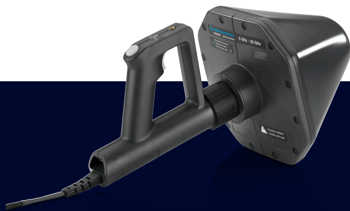
Портативная направленная СВЧ-антенна R&S®HE400MW с антенным модулем R&S®HE400SHF.