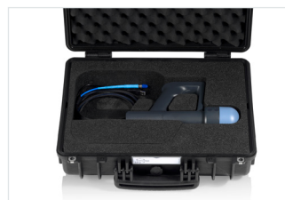
R&S®HE800-PA в транспортном кейсе R&S®HE800Z1.