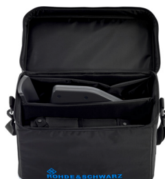
Сумка для транспортировки R&S®HE400Z2 (небольшая).