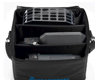
Сумка для транспортировки R&S®HE400Z3 (большая).