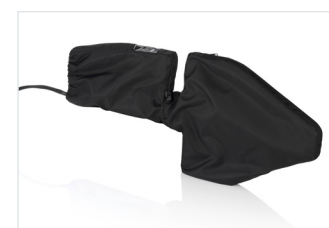
Антенна R&S®HE400 и модуль R&S®HE400LP с дождевиками R&S®HE400-RC и R&S®HE400LPRC.