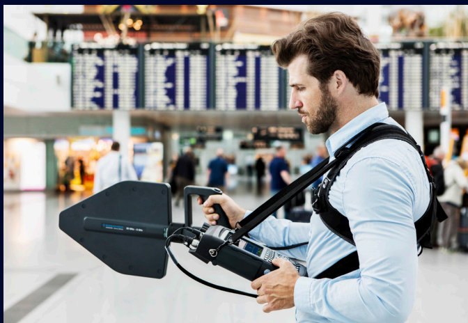
Контроль и наблюдение за использованием спектра.