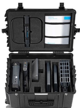
Транспортный кейс R&S®HE400Z1.