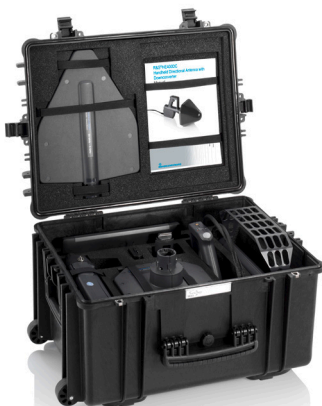
Транспортный кейс R&S®HE400Z7 вмещает антенную рукоятку, антенный модуль R&S®HE400VHF/HE400UWB/HE400SHF и ноутбук с диагональю 15"дюймов.