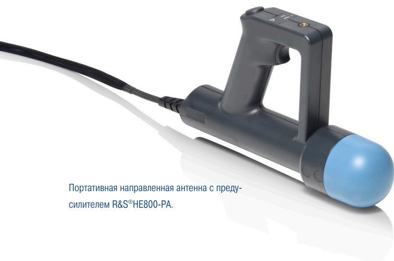
Портативная направленная антенна с предусилителем R&S®HE800-PA.

Портативная направленная антенна с предусилителем R&S®HE800-PA при совместной работе с анализатором или приемником позволяет точно обнаруживать и определять местоположение передатчиков и источников помех в очень широком диапазоне частот от 18 ГГц до 44 ГГц.