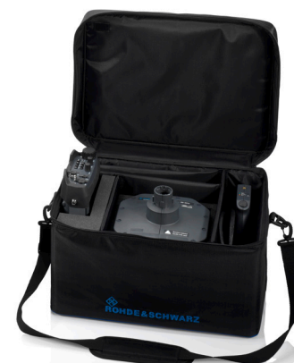
Сумка для транспортировки R&S®HE400Z6, рассчитанная на антенный модуль R&S®HE400SHF/HE400SCB.