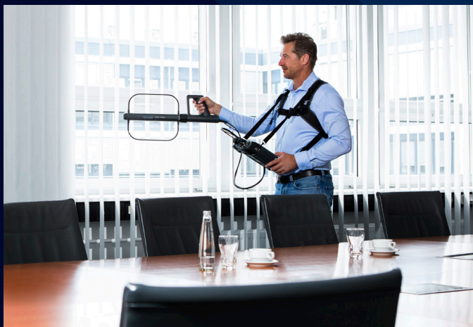
Обнаружение источников помех.