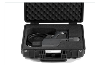
R&S®HE800-DC30 в транспортном кейсе R&S®HE800Z1.