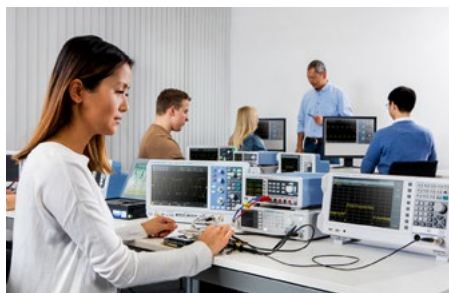
Concebida para su uso en el ámbito educativo, laboratorios y racks de sistema.

Los estudiantes no experimentados pueden utilizar, sin ningún tipo de riesgo, la serie R&S®NGE100 para realizar sus primeras prácticas con sistemas electrónicos, ya que todas las salidas de estos instrumentos están protegidas contra cortocircuito, lo que descarta cualquier posibilidad de que se produzcan daños.