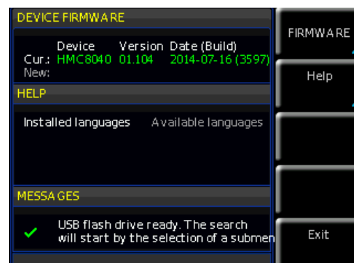
Fig. 1.2: Update menu