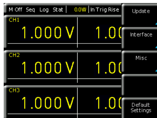
Fig. 1.1: SETUP menu