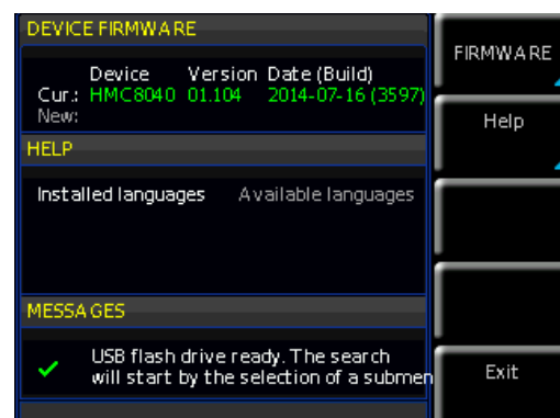
Abb. 1.2: Update Menü