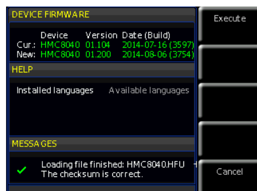
Abb. 1.3: Firmware Update Menü