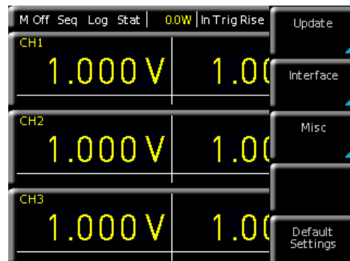
Abb. 1.1: SETUP Menü